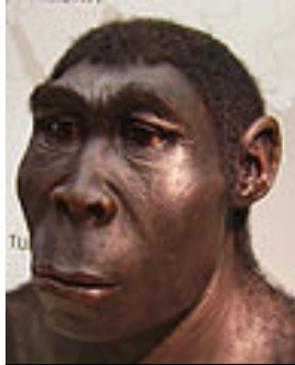
So könnte der Homo erectus ausgesehen haben.

Der Mensch durchlief in der Geschichte einige Entwicklungen, bis er die uns vertraute Gestalt annahm. Die Vorformen des heutigen Menschen wurden unter der Oberbezeichnung „Homo“ zusammengefasst. Die Vertreter dieser Art, wie der Homo erectus, erreichten eine Größe von 1,60 m und wogen bis zu 80 kg. Sie hatten sehr muskulöse Beine, die ihnen als Fortbewegungsmittel besonders bei Jagd und Flucht dienen. Sie erreichten ein Alter von ungefähr 30 Jahren.