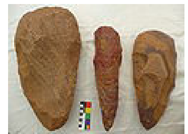
Faustkeile aus Stein.

Die Steinzeit kann in drei Zeitabschnitte unterteilt werden - die Altsteinzeit, die Mittelsteinzeit und die Jungsteinzeit.