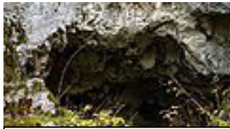
Eine in der Steinzeit bewohnte Höhle.

In der Alt- und der beginnenden Mittelsteinzeit reisten die Menschen von Ort zu Ort auf der Suche nach Nahrung. Auf ihren Zwischenstopps lebten sie in Höhlen oder bauten sich zeltartige Hütten aus Knochen oder Ästen, welche sie mit Tierhäuten bespannten. Um sich vor Wind und Kälte zu schützen gruben sie auch große Löcher in den Erdboden und errichteten dort ihre Unterkünfte.